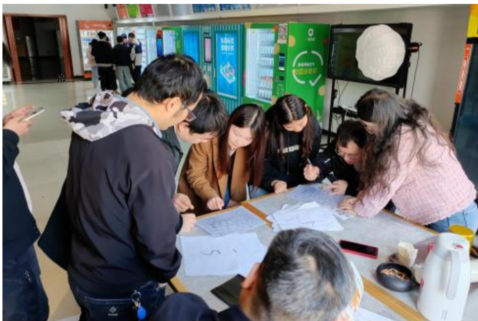
图5 卓 团 建 共