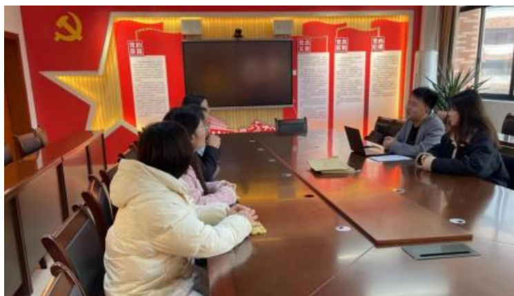
图 1-1 企开展学术 交 会