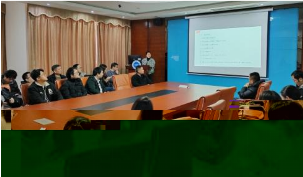
图4 员工专业技 培